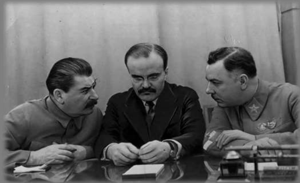
Ираклий Тоидзе — народный художник Грузинской ССР

12 часов дня 22 июня Вячеслав Молотов выступил по радио с официальным обращением к гражданам СССР, сообщив о нападении Германии на СССР и объявив о начале великой отечественной войны