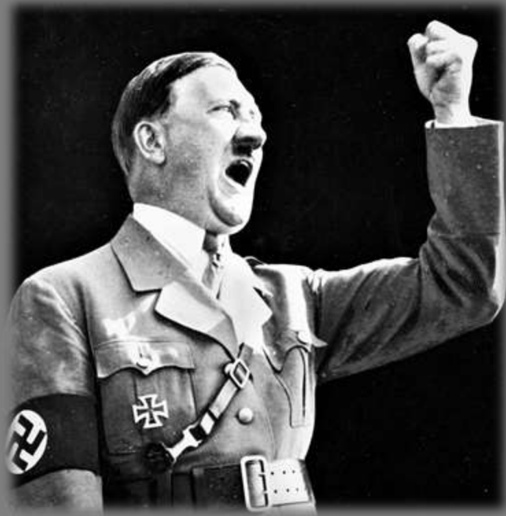
Адольф Гитлер нацист, военный преступник