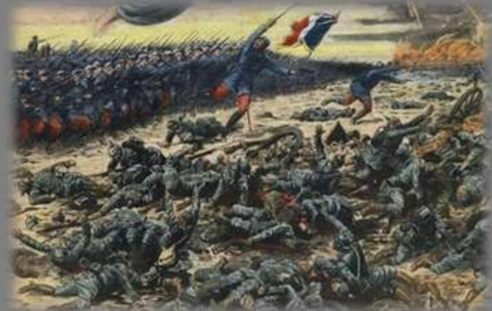
Немецкий «План Шлиффена» Сражение у реки «Марна» 5 сентября 1914